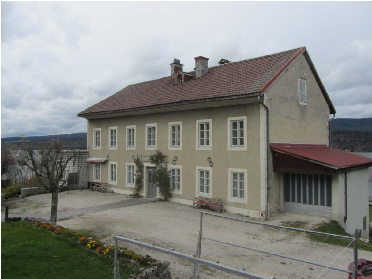
Ancienne école de Vers-chez-Grosjean, celle-là même où Claude Berney fut enseigné. Ses souvenirs sont à découvrir d'urgence sur ce même site.